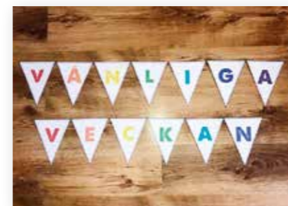
emma_widegren_forfattare: Fira med en vimpel!