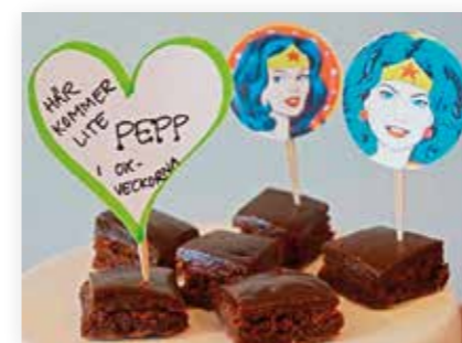
by_ellis: Pepp till förskolepersonalen i oxveckorna.