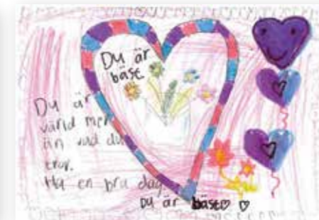
kulturochfritid: Barnteckning till äldreboende i Södertälje.

Vi bad våra givare om olika vänlighetstips mot sig själv och andra: