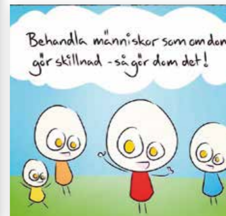
ringar_pa_vattnet: Bild från Herregud och company.