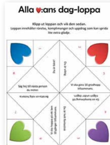
ettstegtaget.marika: Material inför alla hjärtans dag.